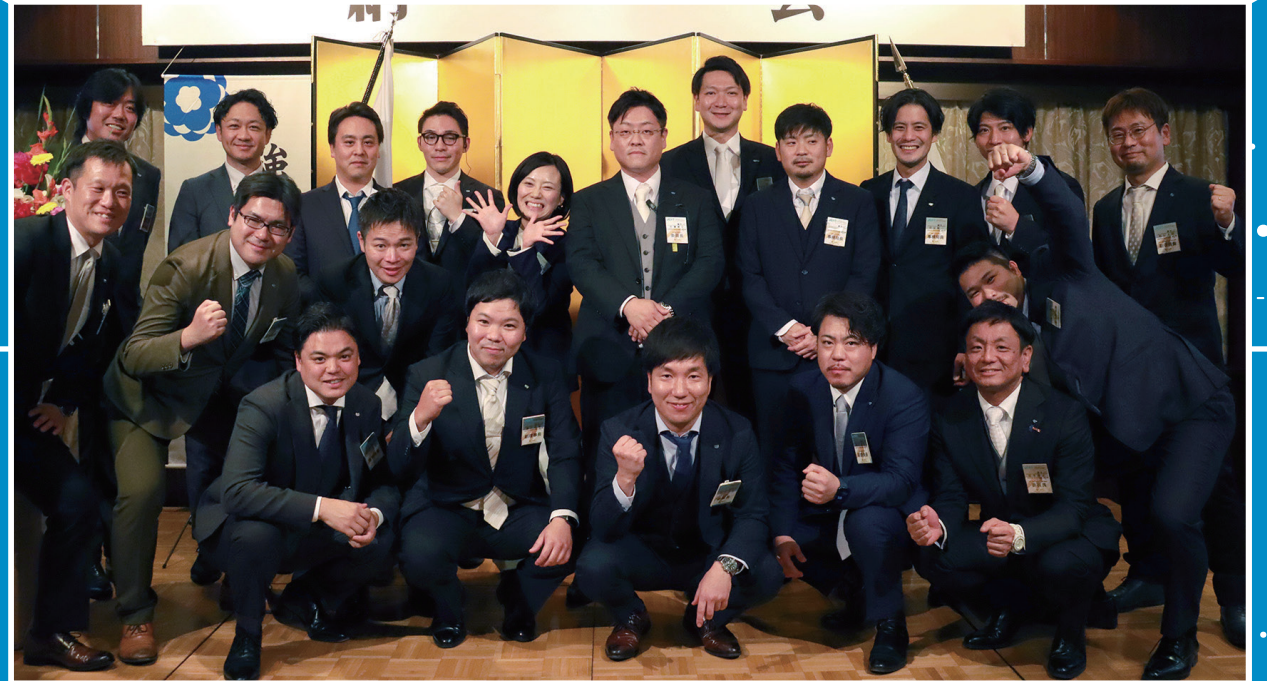
公益社団法人調布青年会議所 2024年度 広報誌